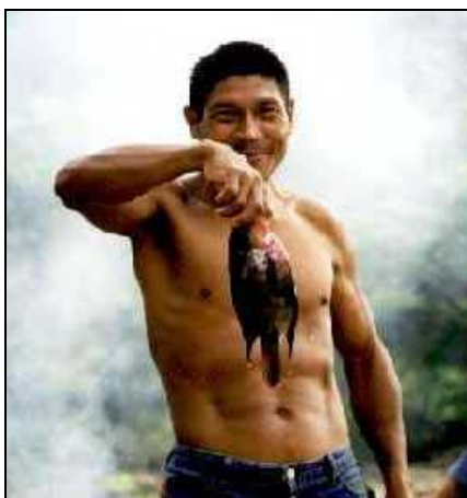
Pech Indio beim Fischen