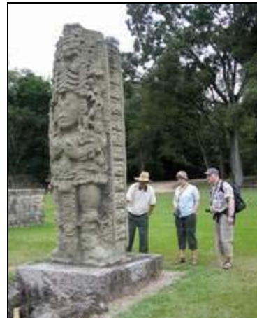
Stele in Copan

Fahrt durch die westhonduranische Hügellandschaft nach Copan, einem mit Kolonialflair aussehendem Bergstädtchen, mit gepflasterten Strassen und roten Ziegeldächern. Copan Ruinas ist eine der größten und bedeutendsten Mayastätte in Honduras. Wir besichtigen unter fachkundiger Führung die eindrucksvollen Tempelanlagen mit den kunstvollen Stelen auf dem Gran Plaza und der längsten Hieroglyphentreppe aller Mayaorte. Außerdem besteht die Möglichkeit den Rosalila Tempel im neu eröffnetem Museum zu bestaunen (optional). Übernachtung in Copan.