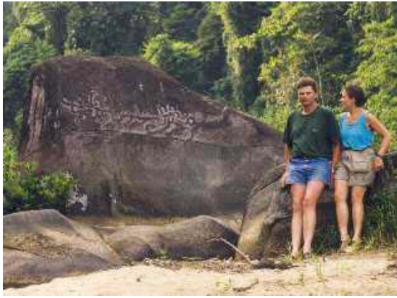
Petroglyphs im Rio Platano